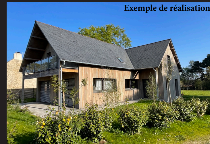
Exemple de réalisation

Frais d'agence inclus : 7% à la charge de l'acquéreur 330 000 € hors honoraires